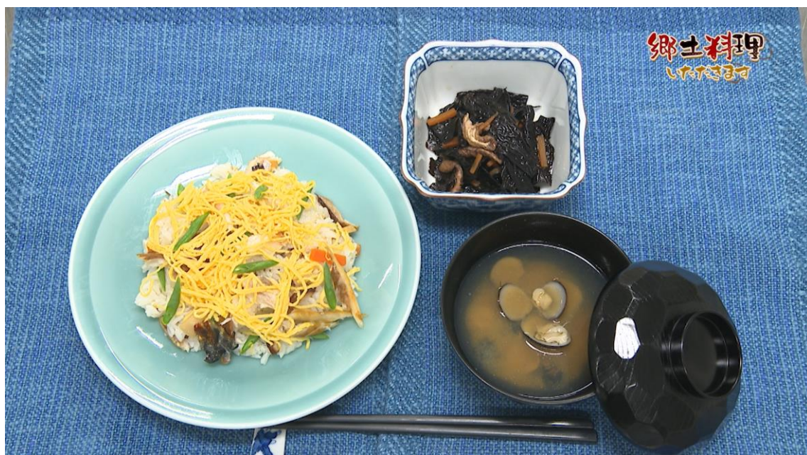
すもじ（焼き鯖のちらし寿司）、隠岐あらめの炒め煮、しじみの赤だし